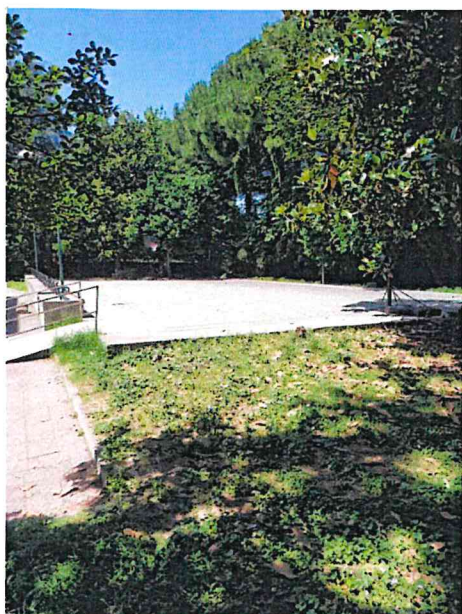
Vista del campo per l'attività sportiva