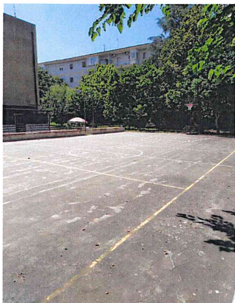
Vista dello stato di degrado della pavimentazione sportiva