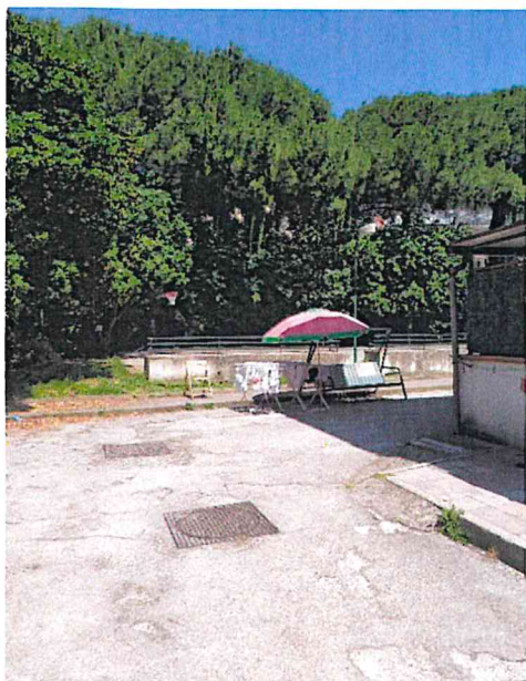
L'immagine mostra l'arrivo alla zona campo nonché la possibilità di transito di mezzi pesanti per la gestione di montaggi od installazioni