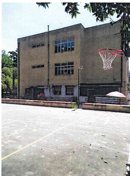
Il rapporto con l'edificio dell'Istituto e l'accesso al campo sopraelevato (si noti nella foto sottostante il lieve dislivello)