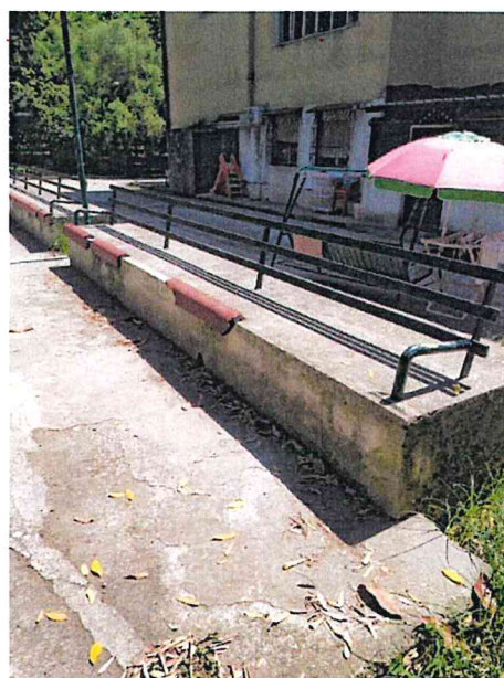
Il gradone che ospita le tribune e le alberature che insistono sul sedime del campo