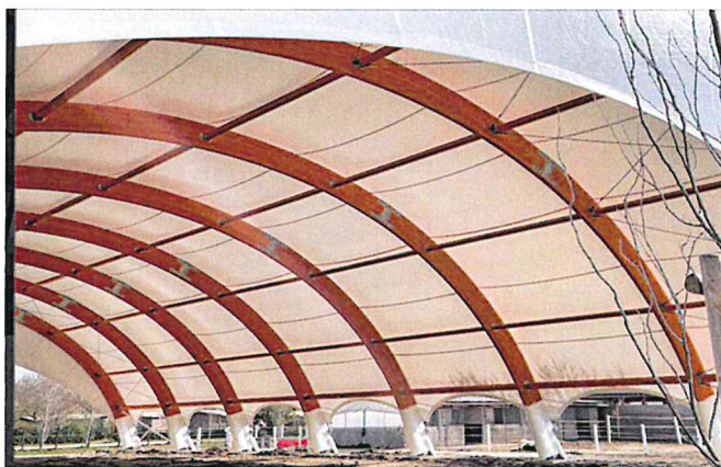
Immagine Esemplificativa | Tensostruttura

La tensostruttura proposta è una struttura in acciaio, ovvero in legno lamellare, alta circa 5 metri tamponata con telo a doppia membrana ed aperta nella parte basamentale che possa coprire un'area di ca 10 metri per 20. Si segnala la possibilità di praticare aperture ovvero di rimuovere la copertura, ma non la struttura nel suo insieme.