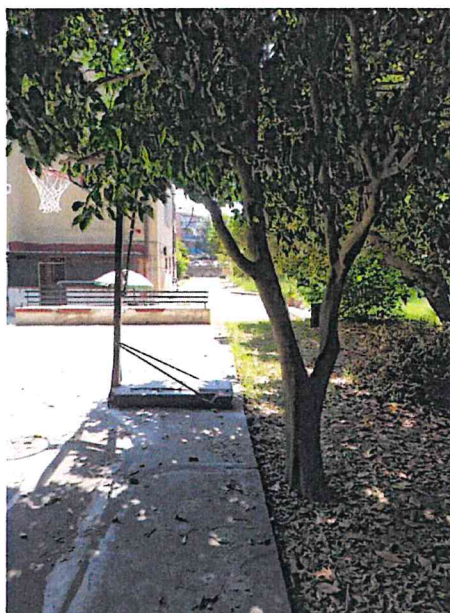
Si noti in questa immagine la prossimità delle alberature con il limitare del campo.